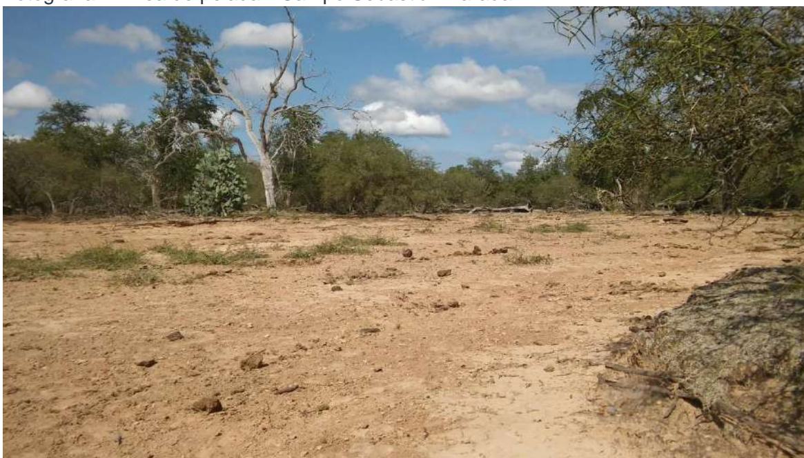
Fotografía 1. Área de peladar- Campo Sebastián Parada, se observan árboles en pedestal.