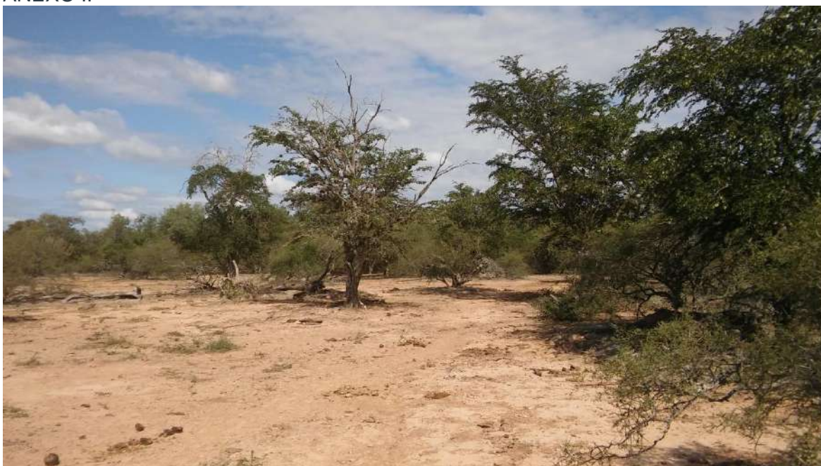
Fotografía 1. Área de peladar- Campo Sebastián Parada.