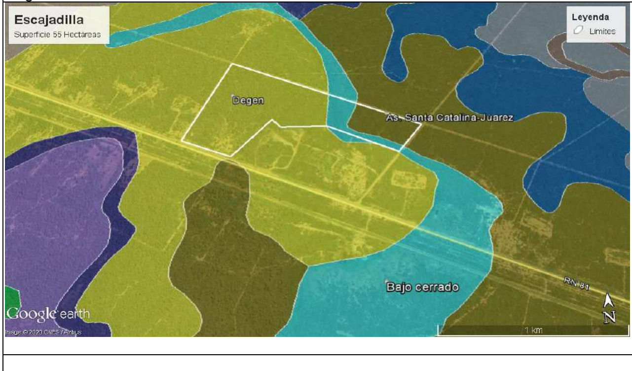
Anexo 1. Mapa de series de suelos del Establecimiento La Maruca: Fuente: Digitalización Juan José Pinto.