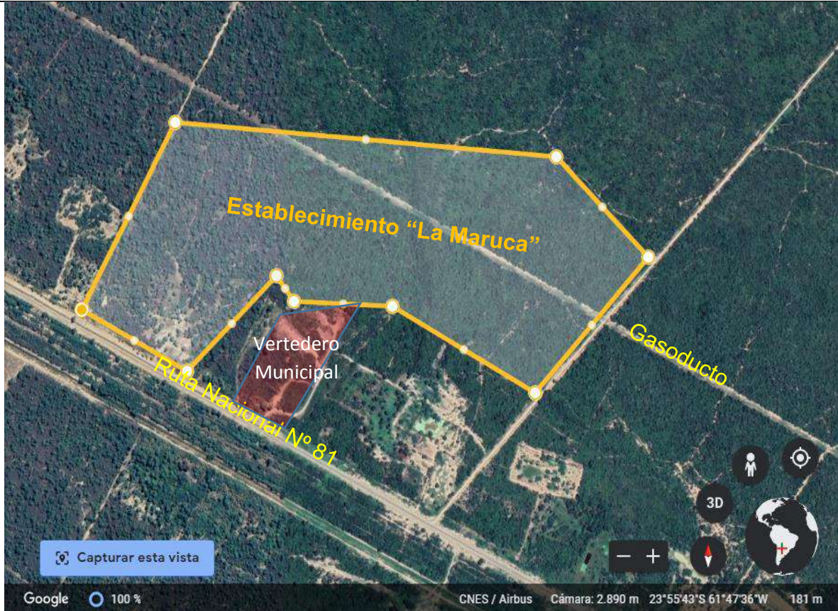
Figura 1.1. Fotografía aérea del predio “La Maruca” con perímetro marcado en línea de color amarillo.